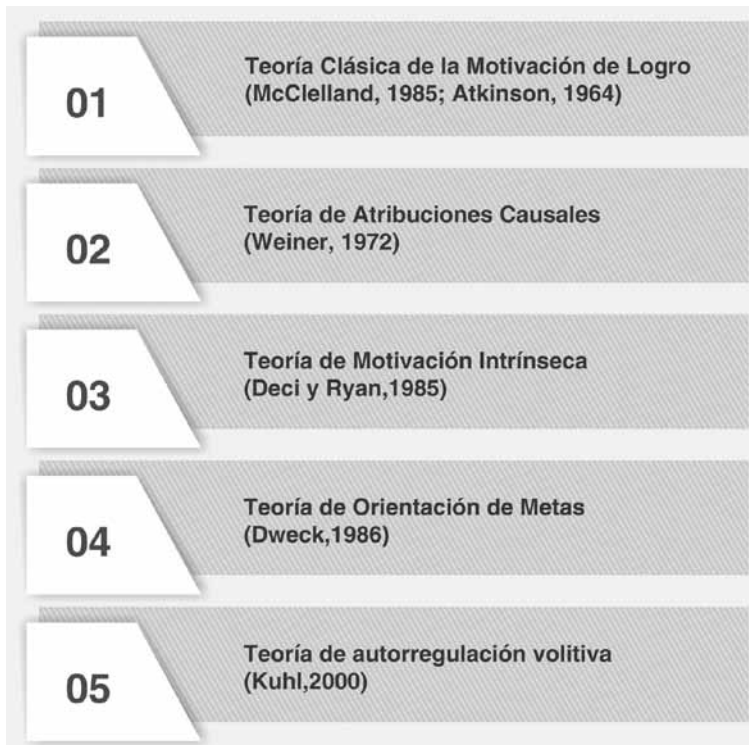
Figura 7.1. Principales miniteorías motivacionales abordadas en este capítulo

Reseñar la diversidad de miniteorías de la motivación es una tarea difícil. Afortunadamente algunos investigadores han realizado valiosas revisiones de las principales teorías (p. ej., Huertas, 1997; Reeve, 2003; Schunk, 2000; Pintrich y Schunk, 2006). Tomando en cuenta dichas revisiones es posible establecer una lista de las teorías de la motivación (y sus autores referentes), que es presentada en la Figura 7.1.